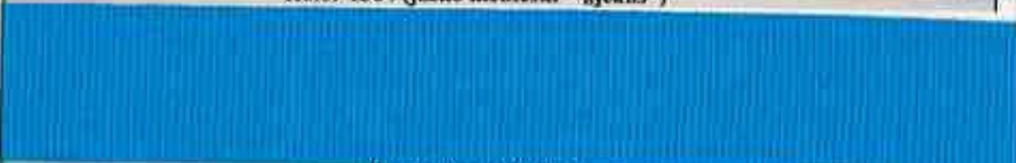
Kolor 1382 (niebieski)