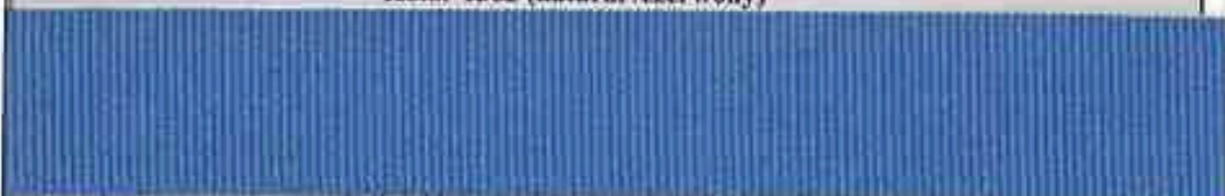
Kolor 1364 (jasno niebieski – „jeans”)