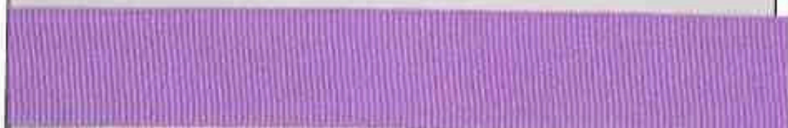
Kolor 1361 (fiolet)

DP/20/02 – taśma odzieżowa rypsowa karta kolorów cz. II – „na zamówienie”